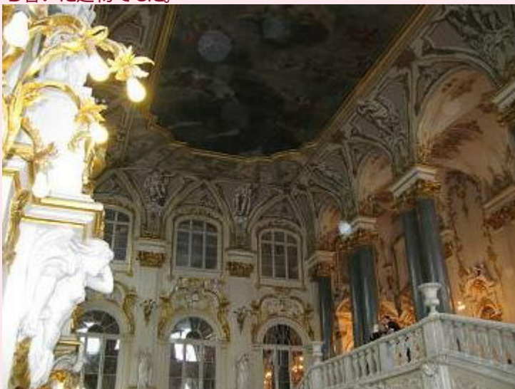
エルミタージュ美術館 「大使の階段」

4時間ほど歩いているうち疲れて昼食を館内の喫茶店で昼を過ぎていたので甘いものしか残っていなかったがお菓子のようパンとコーラを買って食べました。館外へ出ると雨が降っている。次は「イサク寺院」へ。これまた大きく中は金ぴかではなかったが落ち着いた建物でした。