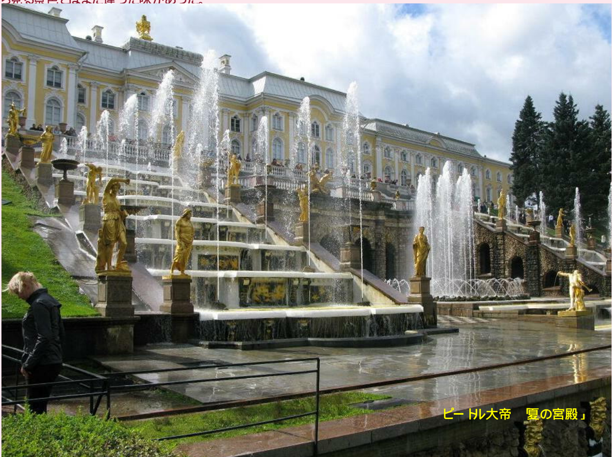
ピートル大帝「夏の宮殿」

その後、市内に帰り「聖イサク寺院」へ建物のらせん階段で塔屋まで上がった。夕食後「運河クルーズ」へ。サンクトペテルブルグはネバー川の河口にできた街なので市街地を運河が無数にありそこを屋根の低い遊覧船に回るもの。大阪の中之島界限を観光船でみるような感じです。橋が低く頭上すれすれに抜けていく。川の水はさほどきれいではなかったが水上から見る景色は陸上から見る景色とはまた違った味があった。