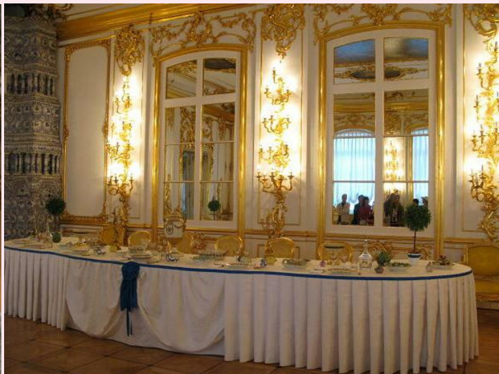
エカテリーナ宮殿

夕食となるのですがまだ陽が高くとてもその気ならないが食べる。ホテルに帰り となりがスーパーマーケットなので買い出しへ。この店、外見はとてもスーパーとは思えない建物、中に入ると日本のスーパーと同じでした。水と土産を購入した。両替は関空でしておいた。(1050円で3000ルーブル)食料品は日本よりかなり安い(給料が違うのであたり前だ)。