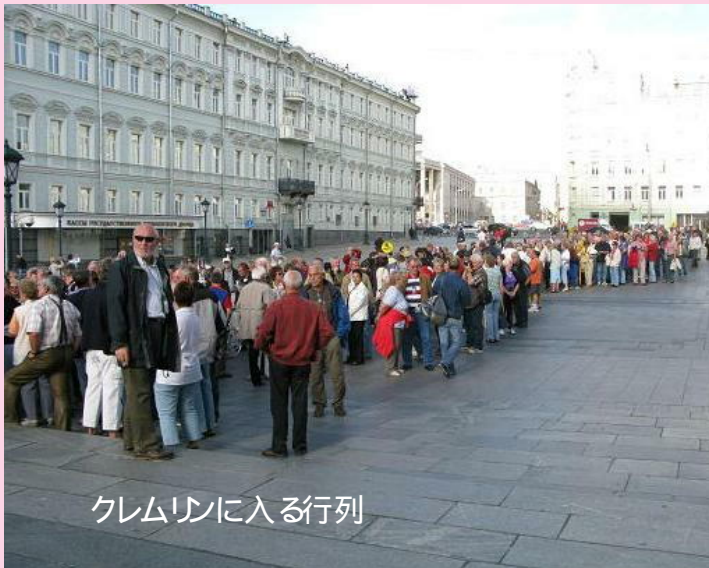
クレムリンに入る行列