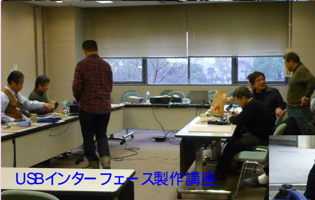
USBインターフェース製作講座