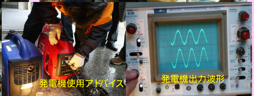
発電機使用アドバイス