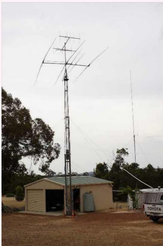
写真22 :シャックのあるガレージ、アンテナと右端に貯水タンクが見える