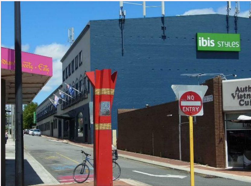
写真11 :SEANET1998の会場だった元ホテル