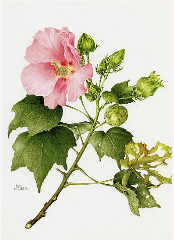
写真5 ボタニカルアートの作品例 (田地川和子作)

2006年のSEANET大阪では名誉ある申し込み1番乗りで、ホテルアイハウス最上階の3人部屋に宿泊し、SEANET終了後姫路に移動、再び大阪に戻って拙宅にも泊って頂いた。しばらくして彼から頻りに工事進捗の写真が届くようになった。近隣へのインターフェアーの事を聞いていたので、別のところにシャックを建設しているのだらうとは思っていた。彼が送ってくる写真は、最初に大きな貯水タンクのベースの土間の写真、次はガレージ(後でその半分がシャックと判明)の骨組みの写真、そして次は家庭用には巨大なピザオープンの写真など部分的なもののみで、完成の姿を想像してまるでパズルのようであった。出来上がったら招待すると言ってくれていたのが、今回実現したのだ。