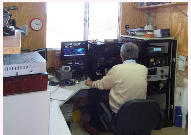
写真23 :ゲストオペ中の私