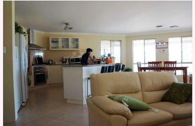
写真19 :リビングの様子1