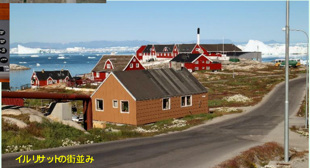
イルリサットの街並み