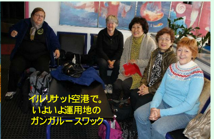
イルリサット空港で。いよいよ運用地のガンガルスワック