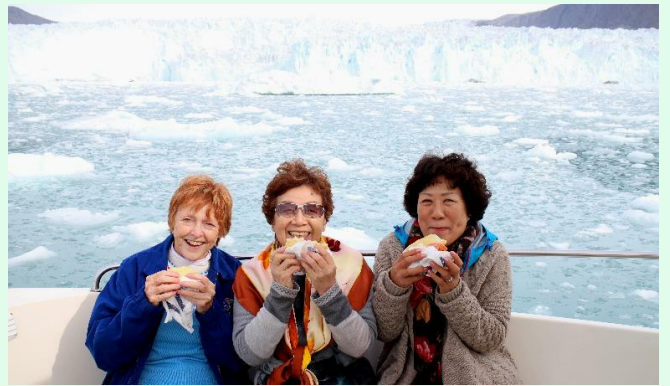
大氷河の前で震えながらサンドウィッチを食べる