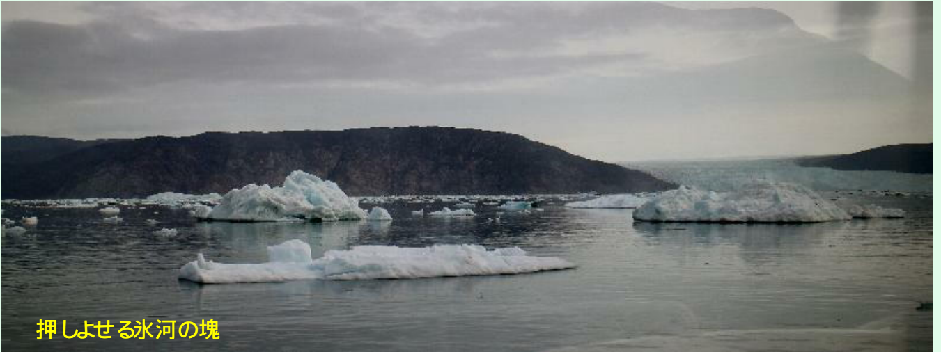
押しよせる氷河の塊