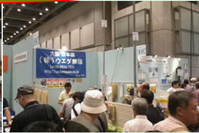
ウエダ無線さんのブース

8月24、25日と2日間、東京ビッグサイトで開催されました「ハムフェア2013」に行ってきましたのでその様子を報告させていただきます。