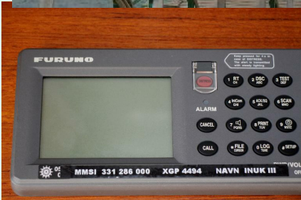
氷河クルーズの船上にあった日本製