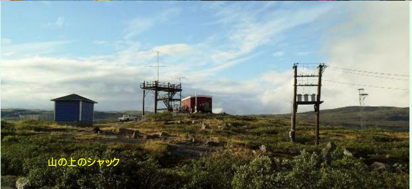
山の上のシャック