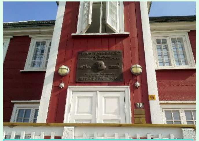
ミュージアム、中は歴史的な品々で埋められていた