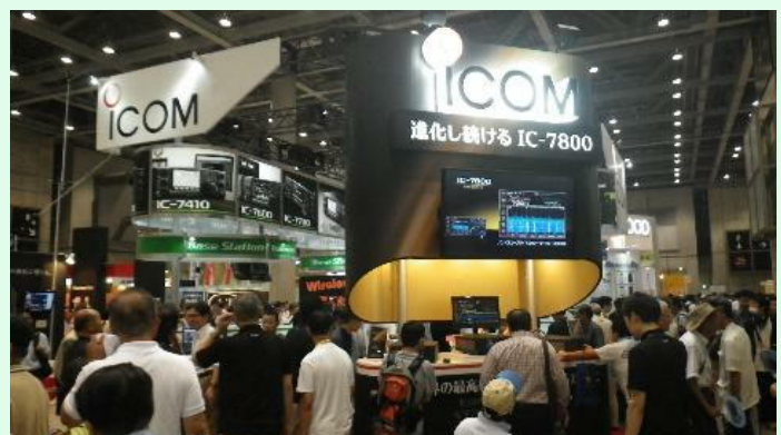
メーカー展示 アイコムさん