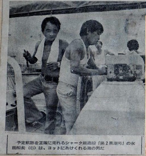
第3回シャークハンティング