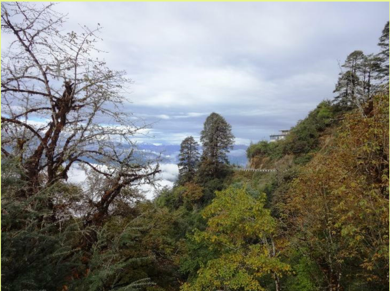
OPIには絶好のロケ、トチュラリゾート