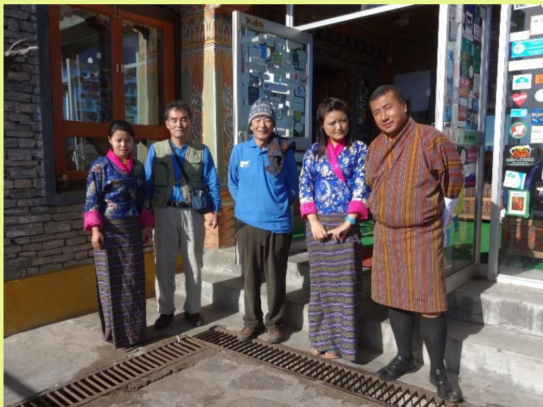
スタッフは全員民族衣装 (観光に携わる者の制服か?)