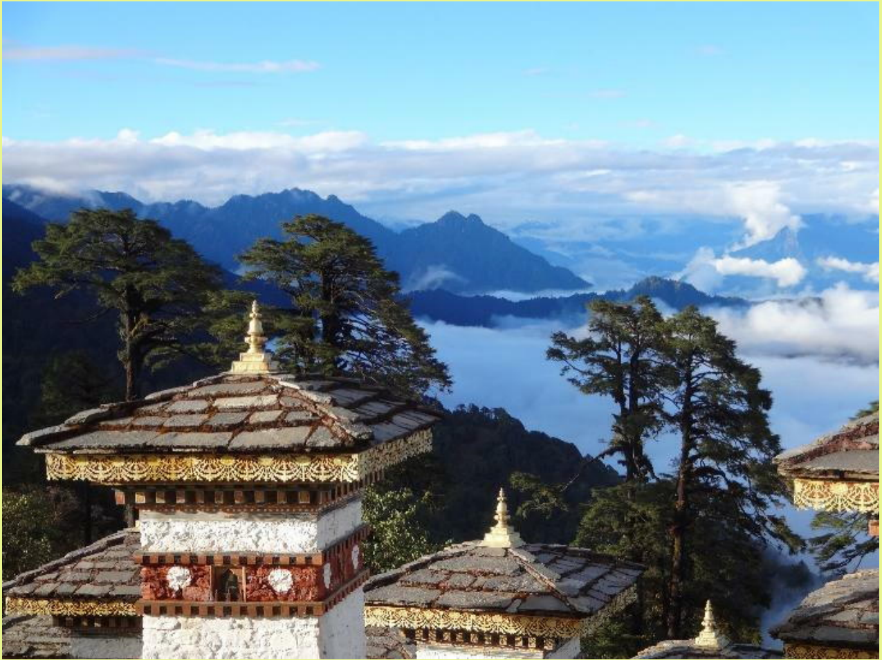
晴れたトチュラ峠