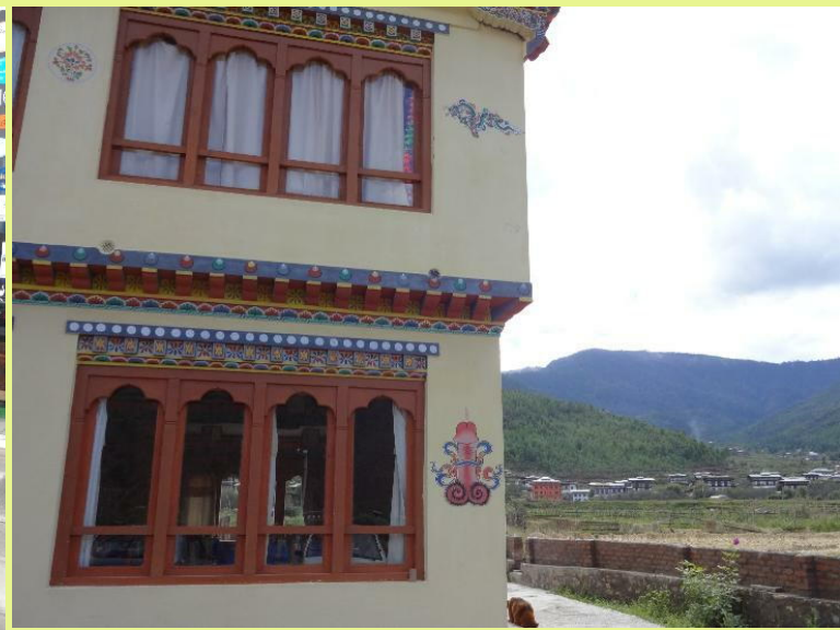
壁に描かれた図案。全く普通に見られる光景で、市民はその下で普通に生活を営んでいる