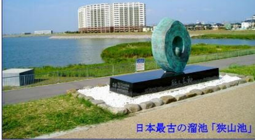
日本最古の溜池「狭山池」