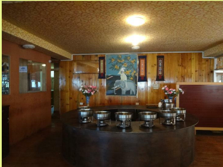
内装は全て木製でシック、料理も日本人好み