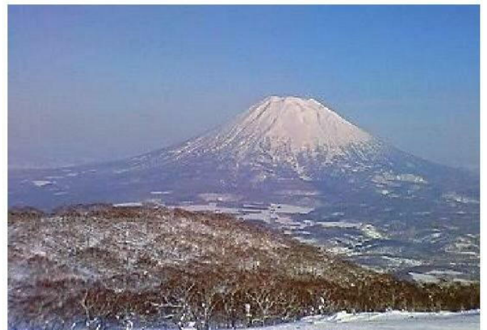
蝦夷富士 羊蹄山 <ニセコヒラフ 1996m台地より>