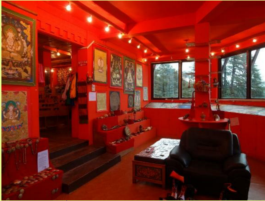
びっくり 真っ赤な内装の部屋も