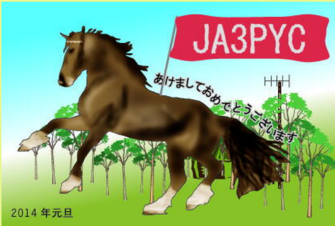
年末にアドビのイラストレータとフォトショップの集中講義を受けたので、新年の挨拶カードを作ってみました。少し、マンガチックな仕上がりにですが・・・ JA3PYC 山本哲夫