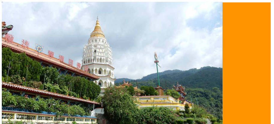
極楽寺と極楽寺の花

ペナンに帰り、果物の王様といわれるドリアンを初めて食べました！ドリアンの木々の下で食べた新鮮なドリアンは、イメージしていたものとは大きく違い、匂いもほとんどなく、意外に美味しかったです。このドリアンを食べるに毎年訪れる日本人も多いとの事でしたが、納得しました。ドリアンのイメージを一新した経験でした。大きなスーパーマーケットには、新鮮な食材や商品が数